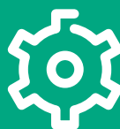
Energianvändning (kWh/kvm A temp )

Energieffektivisering och minskad energianvändning är viktiga verktyg för att reducera de koldioxidutsläpp som våra fastigheter ger upphov till, och därmed minska vår klimatpåverkan.