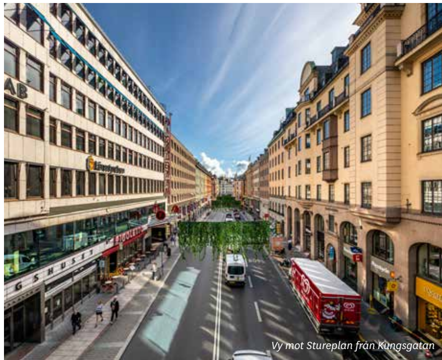
Vy mot Stureplan från Kungsgatan