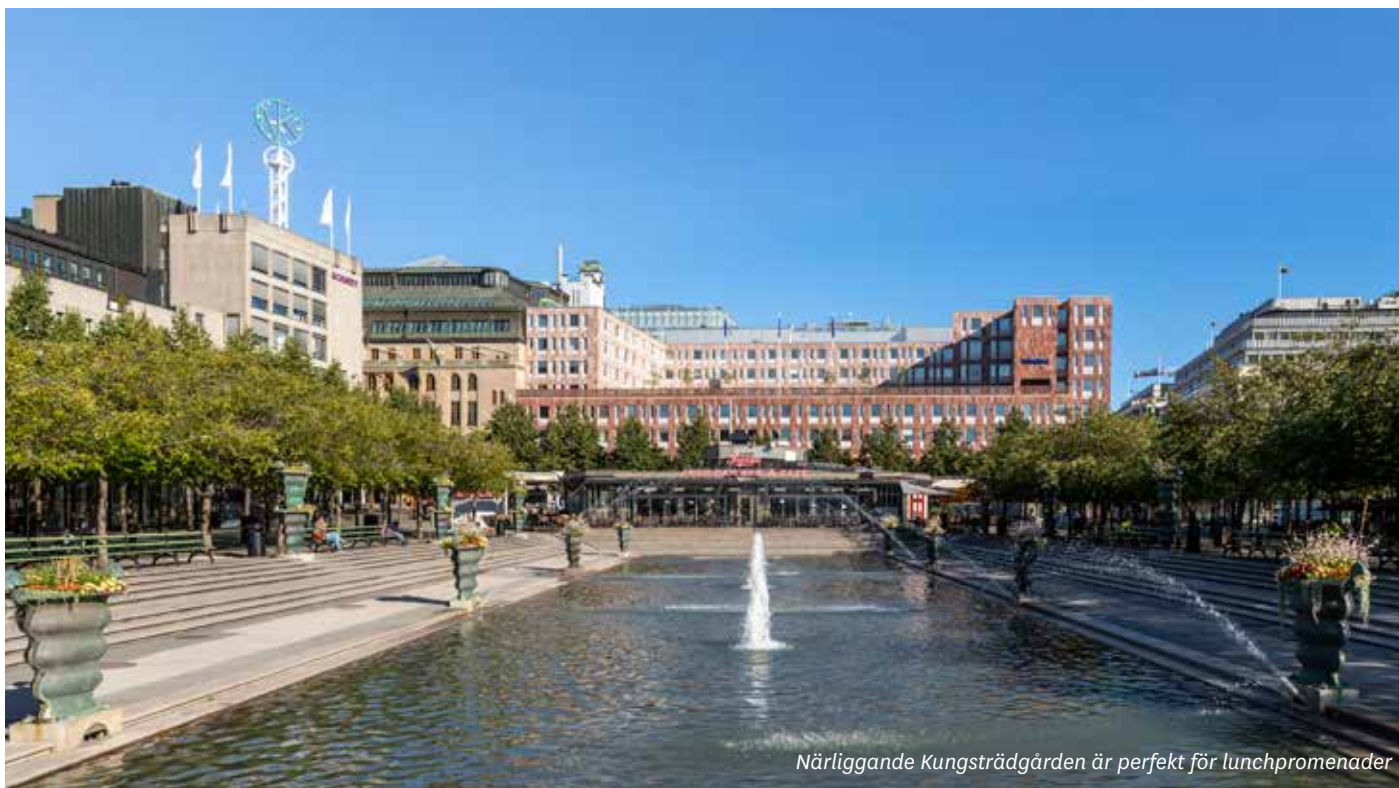
Närliggande Kungsträdgården är perfekt för lunchpromenader