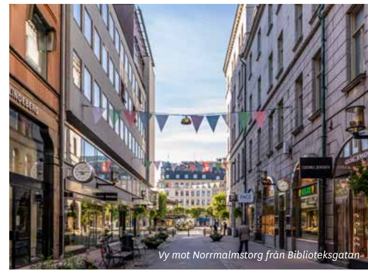
Vy mot Norrmalmstorg från Biblioteksgatan