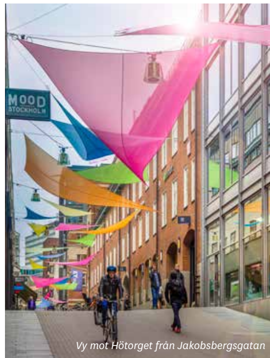
Vy mot Hötorget från Jakobsbergsgatan