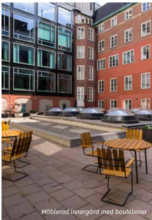
Möblerad innergård med boulébana