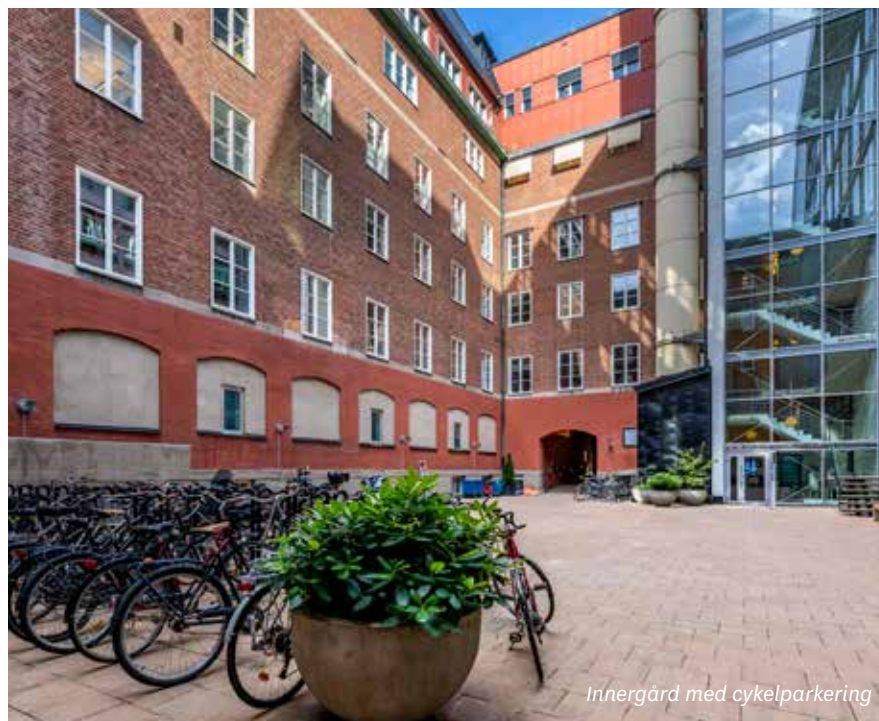
Innergård med cykelparkering