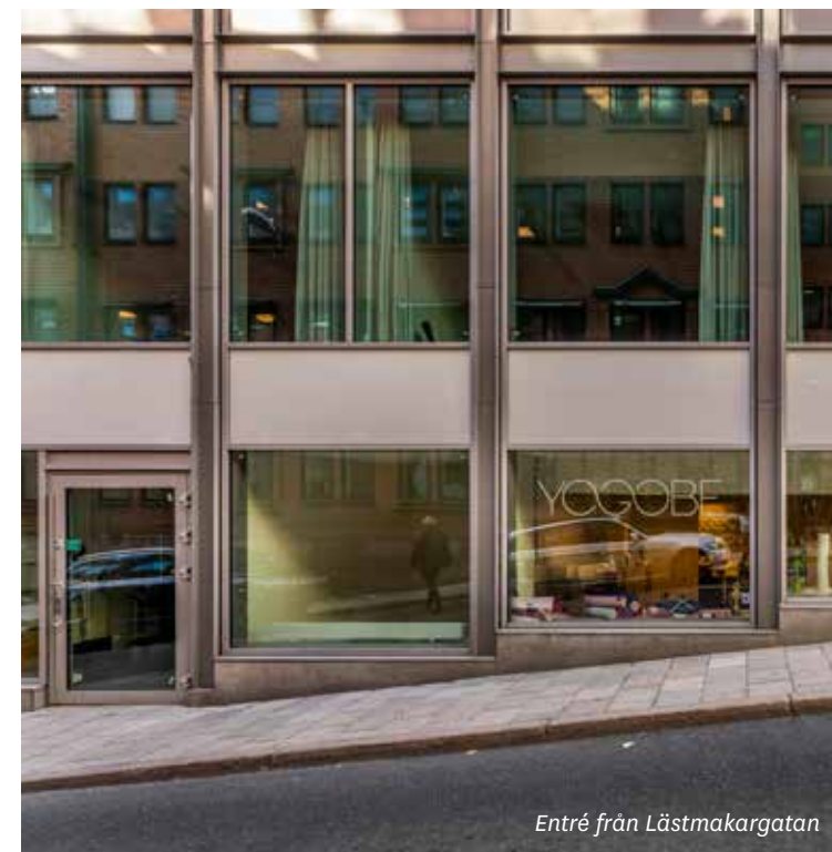
Entré från Lästmakargatan