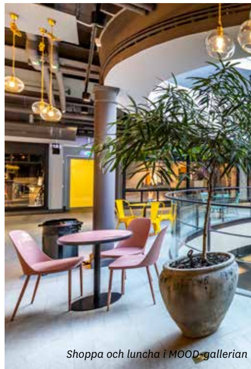
Shoppa och luncha i MOOD-gallerian