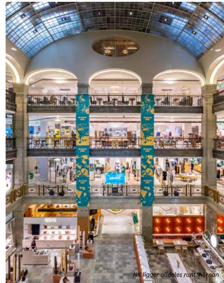
NK ligger alldeles runt hörnan