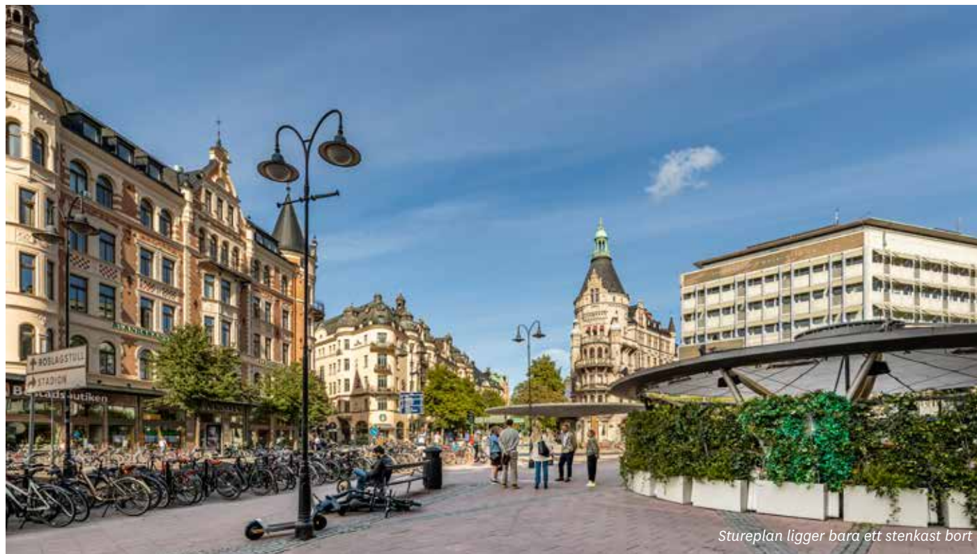
Stureplan ligger bara ett stenkast bort