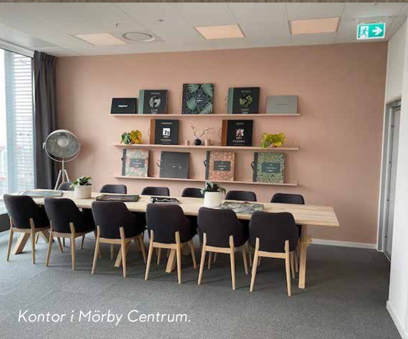
Kontor i Mörby Centrum.