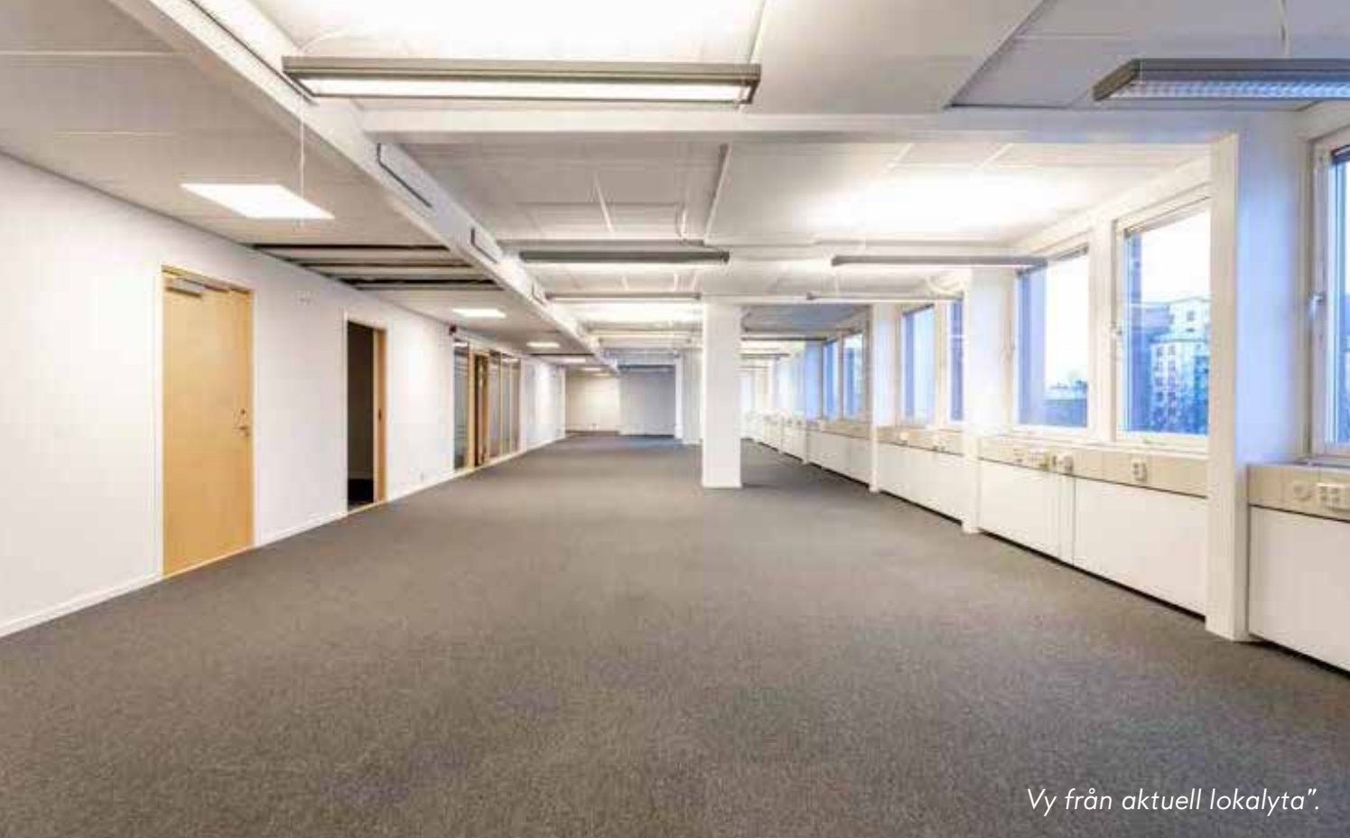
Vy från aktuell lokalyta".