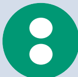
Besöksadress: Masttorget 6