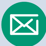
Skandia Fastigheter AB Masttorget 6 211 77 Malmö