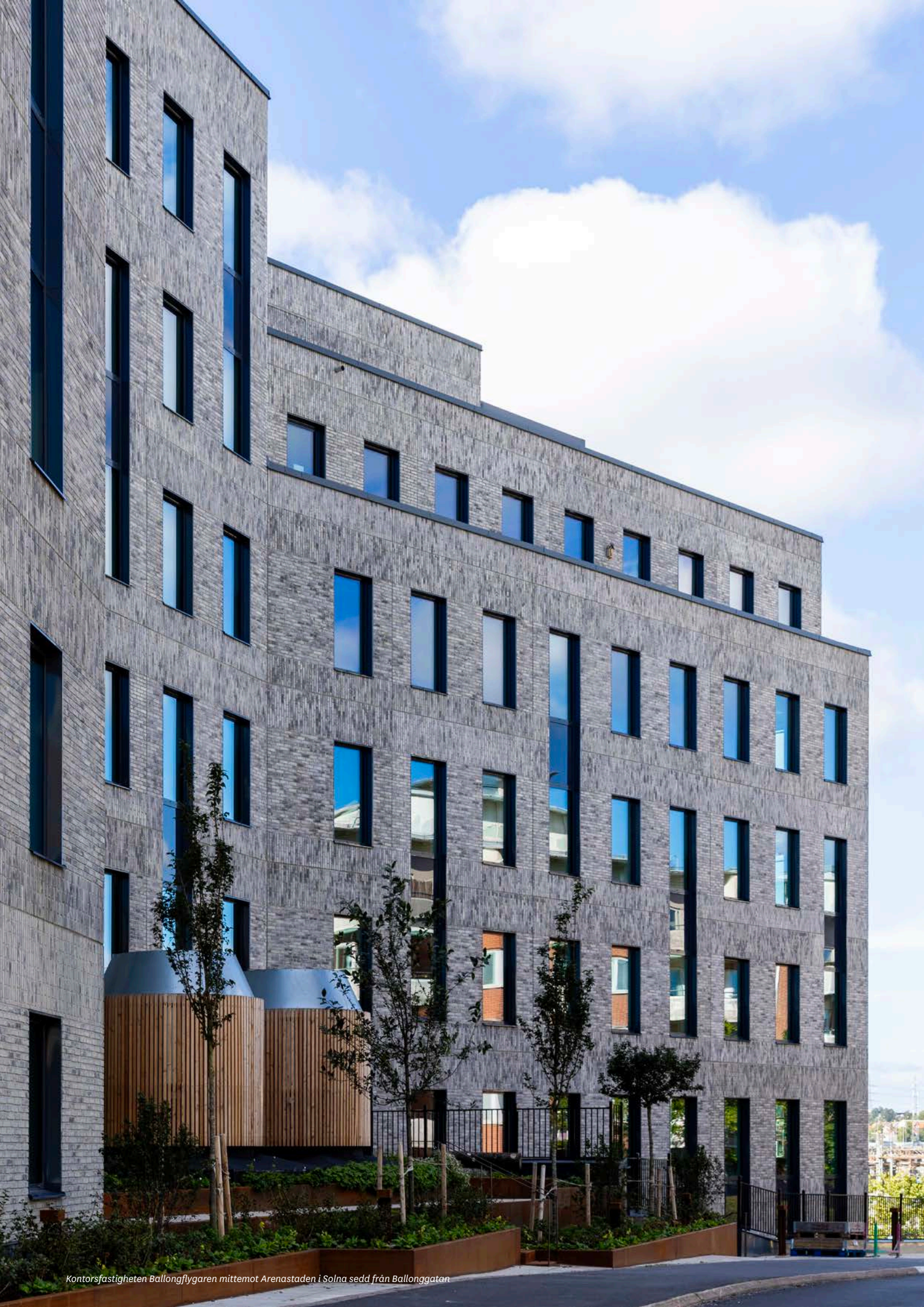
Kontorsfastigheten Ballongflygaren mitt emot Arenastaden i Solna sedd från Ballonggatan