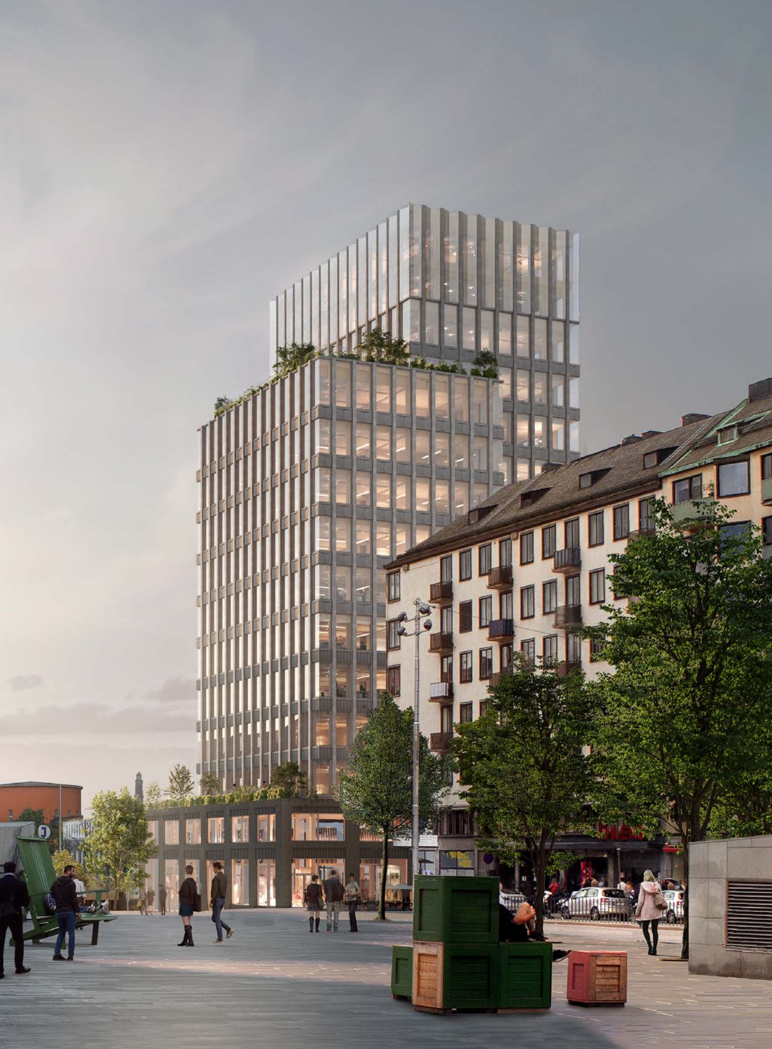
Visionsbild över vårt pågående projekt Spelbomskan 9 (Läkarhuset) på Odenplan i Stockholm