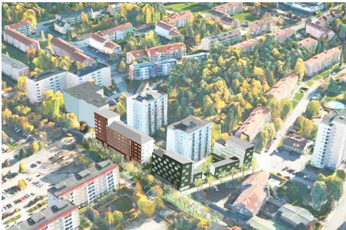
Jakobsberg – de färgglada fasaderna visar var de nya bostäderna kan placeras.