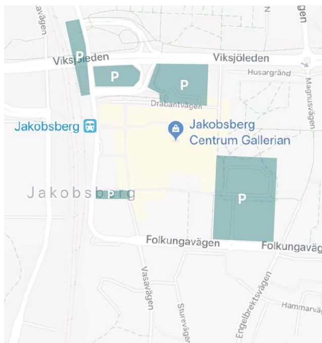
Karta över allmänna parkeringar i närområdet