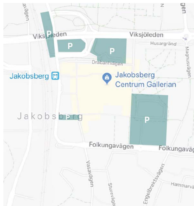
Karta över allmänna parkeringar i närområdet