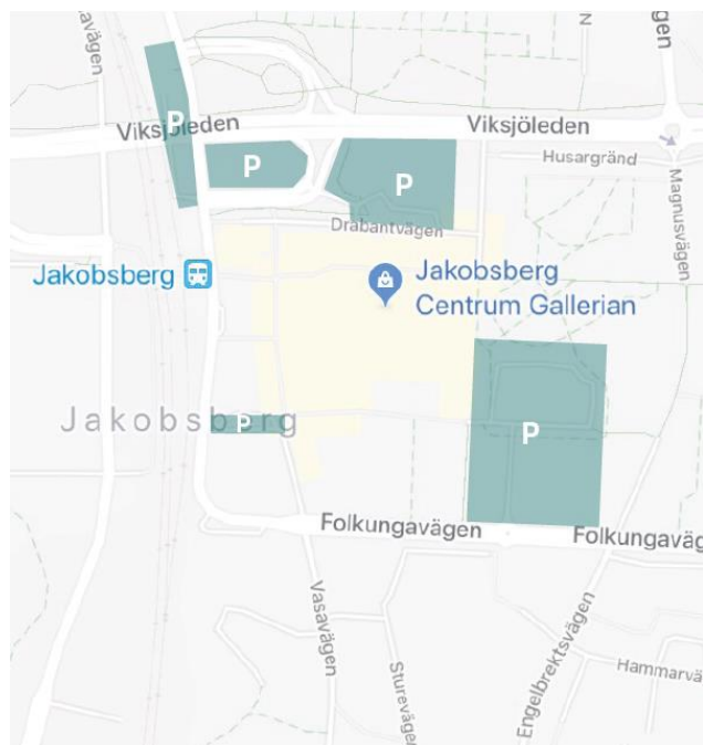
Karta över allmänna parkeringar i närområdet